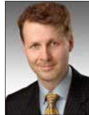
PUHEENJOHTAJA RISTO SIILASMAA, S. 1966

Nokia Oyj:n hallituksen puheenjohtaja. Nokia Oyj:n väliaikainen pääjohtaja 3.9.2013–1.5.2014. Hallituksen jäsen vuodesta 2008. Puheenjohtaja vuodesta 2012. Nimitysvaliokunnan puheenjohtaja 3.9.2013 saakka.