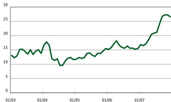
Nokian ADS:n kurssi New Yorkin pörssissä USD